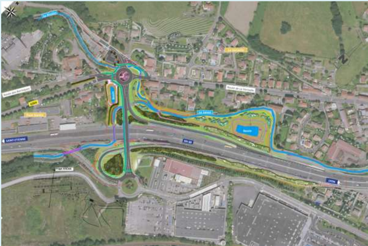
Vue en plan du projet dans l'environnement proche – Illustration extraite du dossier d'enquête

Enquête publique préalable à une autorisation environnementale comprenant une autorisation au titre de la Loi sur l'eau, une dérogation au régime de protection des espèces protégées et une évaluation environnementale pour le projet d'aménagement de la RN 88 – complément du demi-échangeur de La Varizelle sur la commune de Saint-Chamond – à la demande de la Direction de l'environnement, de l'aménagement et du logement Auvergne Rhône-Alpes (DREAL ARA)